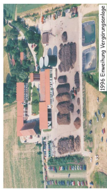
1996 Einweihung Vergärungsanlage