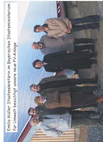
Emilia Müller, Staatssekretärin im Bayerischen Staatsministerium für Umwelt besichtigt unsere neue PV-Anlage