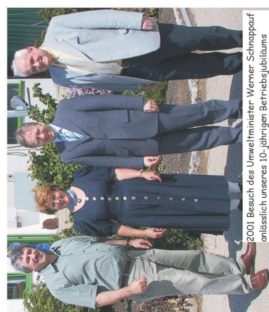
2001 Besuch des Umweltminister Werner Schnappauf anlässlich unseres 10-jährigen Betriebsjubiläums