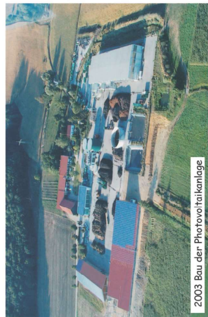
2003 Bau der Photovoltaikanlage