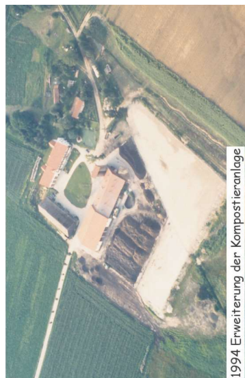
1994 Erweiterung der Kompostieranlage