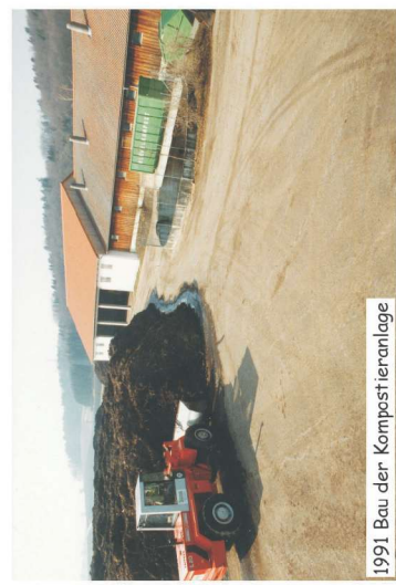
1991 Bau der Kompostieranlage